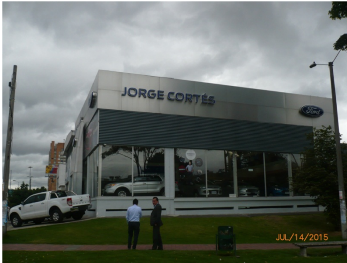
Fotografía No. 2: Elemento en Fachada Norte del establecimiento JORGE CORTES MORA Y CIA LTDA ubicado en la Autopista Norte No. 118-89.