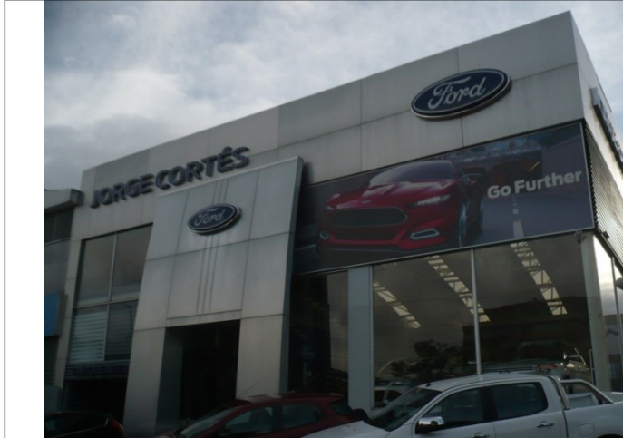
Fotografía No. 1: Elementos en Fachada Oriental del establecimiento JORGE CORTES MORA Y CIA LTDA ubicado en la Autopista Norte No. 118-89.