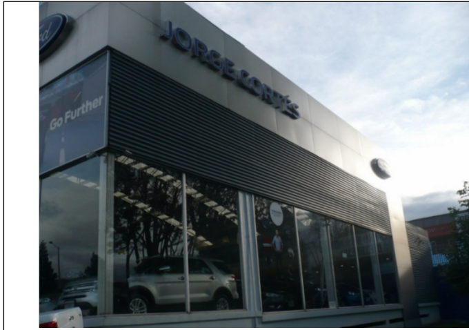
Fotografía No. 2: Elemento en Fachada Norte del establecimiento JORGE CORTES MORA Y CIA LTDA ubicado en la Autopista Norte No. 118-89.